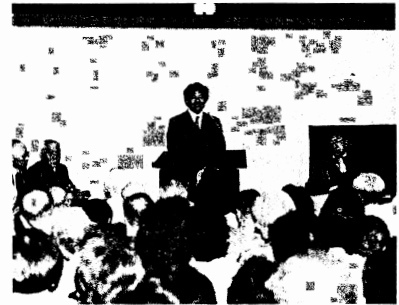
金華老人クラブ連合会福祉大会にて、豊かな日本を築かれた先輩方にご恩返しをすることは、若い世代の務めと思う。