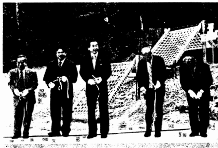
稲荷山公園改修工事の完成式にて、市民の憩の場としてリニューアル。