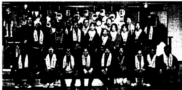
JR岐阜駅高架下ハートフルスクエア-Gのオープン催事に、金華安宅車の「からくり」が出演。