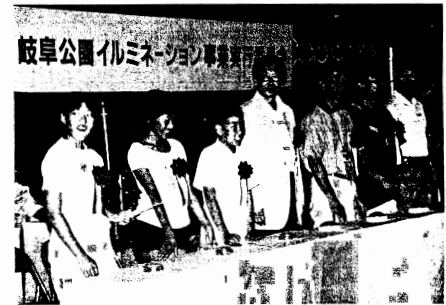
岐阜公園イルミネーション事業の点灯式にて、大勢のボランティアの力の結集に感激。