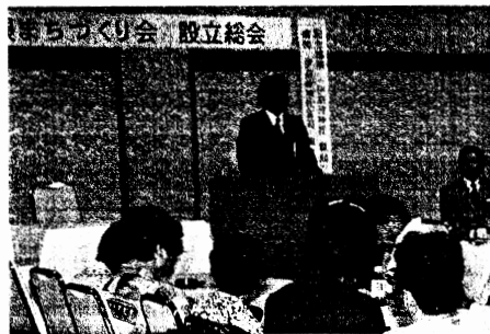
「伊奈波界限まちづくり会」が発足。旧岐阜町からの歴史ある地域。我が町を愛する取り組みに成功あれ。