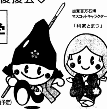
加賀百万石博 マスコットキャラクター 「利家とまつ」

※ 9月21日までにお申し込みください。但し定員になり次第締め切らせていただきます。