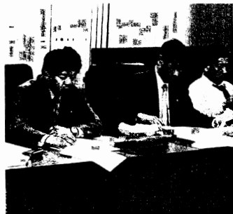
視察先(厚生委員会)の尾道市にて、高齢者生活支援事業の実例を学ぶ。