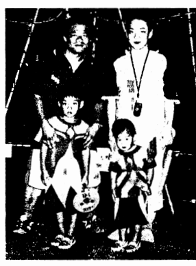
長男は岐阜幼稚園の年長組。次男は一歳。子供達の未来に責任ある市政を!

は、岐阜市に新しい風が吹いたと各マスコミが報道しました。その変革を求める強い風は、市長に対してのみでは無く、市役所全体、そして議会に対しても向かっているものと考えなければなりません。岐阜市を変えたい、春一番を吹かせた市民の意識が何を望んでいたのか、私たち議員も察しなければいけないと思っています。市民が吹かせた新しい風を追い風と捉え、今こそ、持ち前の若さと民間企業出身の感覚で、市民が主役の市政へと邁進して参ります。皆様の一層のご指導を宜しくお願い申し上げます。時節柄、お身体ご自愛のほどお祈り申し上げます。