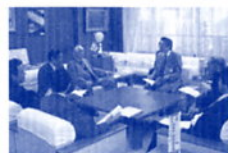
会派として新年度予算要望