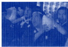
岐阜まつり育宮 金華神輿