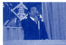
校区敬老会・校区文化祭で挨拶