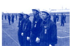
消防団特別点検に出場