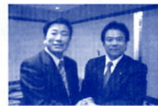
古田肇岐阜県知事と懇談