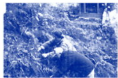
伊奈波広場池周辺の清掃