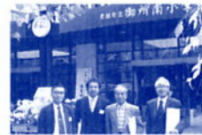
他都市の統合モデル校視察