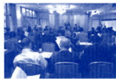
金華自治会連合会総会