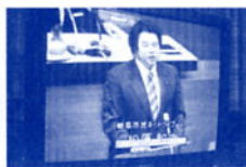
本会議代表質問 テレビ中継