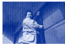
金華公民館の大掃除