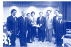
国土交通大臣に要望活動