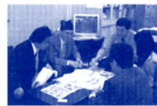
市部長・自治会連合会長と打合せ