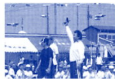
金華市民体育祭 会場係