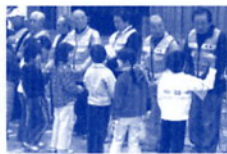
見守りボランティア感謝会