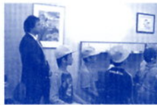
学校行事「金華の町めぐり」