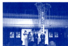
岐阜市・柳津町合併式