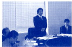
建設委員長として会議進行