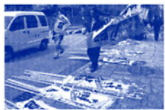
岐阜まつり育宮 のぼり立て