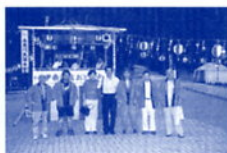
伊奈波盆踊り大会役員