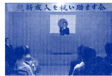
金華校区成人式で祝辞