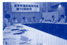
東海若手市議会議員の会総会