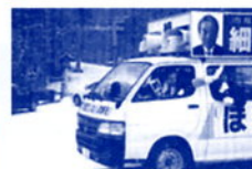
街宣車でマイクを握る