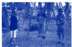
岐阜公園イルミネーション作業