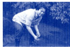
カワニナ（蛭のえさ）放流