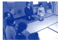
金華婦人会春のお茶会