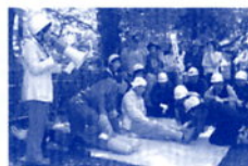
金華校区防災訓練（発災型）