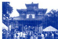
ぎふ大仏フェスティバル