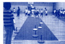
金華スポーツ少年団宿泊研修