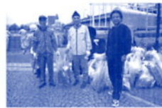
長良川を美しくしよう運動