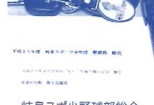
岐阜スポ少野球部総会