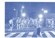
大宮陸開の開閉点検