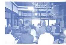
妙照寺落慶記念行事