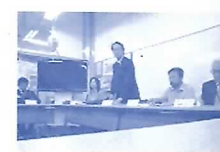
岐阜小学校運営協議会