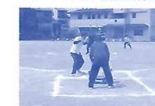
金華地区ソフトボール大会