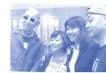
高橋尚子マラソン歓迎式典