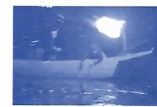
長良川鶴飼観覧船に乗船