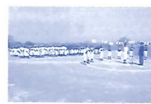
中部学童野球総合開会式