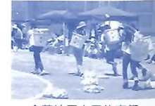
金華地区市民体育祭