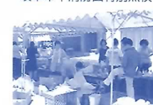
京町ふれあい市場