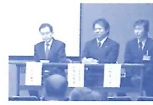
井の口まちづくり会総会