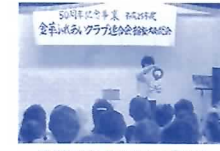
金華ふれあいクラブ総会