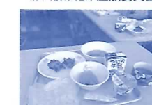
岐阜小学校の給食試食会