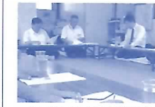
わいわいハウス金華総会