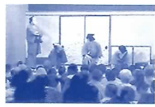
第2回 岐阜まち歌舞伎