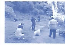
稲荷山公園の清掃