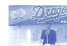
ドラゴンズ岐阜後援会総会