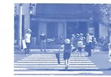
岐阜中央中学校区 挨拶運動