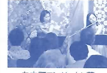
白木町コンサートin蔵