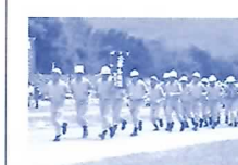
岐阜市水防連合演習