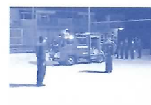
金華消防分団操法演習訓練