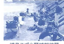
岐阜スポ少野球部練習