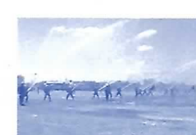
岐阜市中消防団特別点検