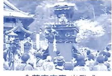
金華安宅草 出発式