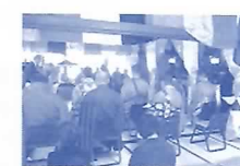
金華福音信託会 花まつり