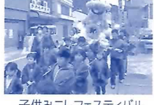
子供みこしフェスティバル