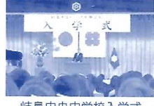
岐阜中央中学校入学式