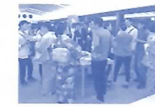
長良川おんぱくキックオフ会