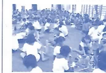
子どもフェスティバル