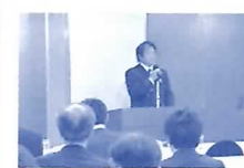
川原町まちづくり会総会