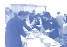
ぎふまちづくりセンター総会