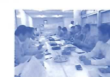
柳ヶ瀬お化け屋敷委員会