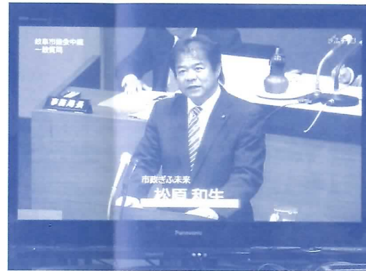
※6月18日、ぎふチャンネル中継より

※その他、「ぎふCITYウォッチャーズの活用について」を市長公室長に、「納涼台のこれからについて」を商工観光部長に質問しました。