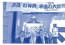
木造神輿 大修理 完成式