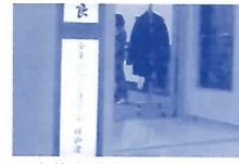
金華自治会連合会総会